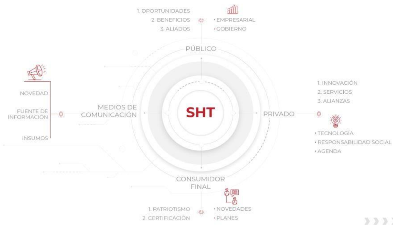
Gráfico público objetivo y tipos de mensajes.

Finalmente, la Sociedad Tequendama publica en la página web www.sociedadtequendama.com los informes de gestión que se rinden a la asamblea de accionistas, así como el cronograma de reuniones con los diferentes grupos de interés.