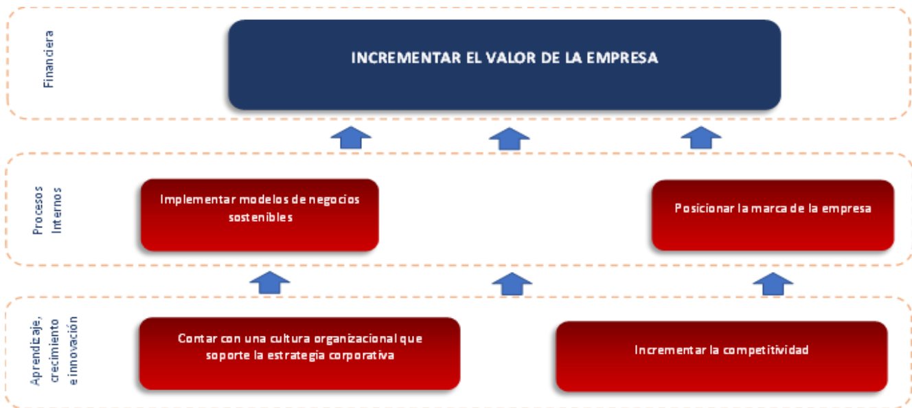
Gráfico: Mapa Estratégico Sociedad Tequendama Plan Avante 2022 -2026. Fuente: Elaboración propia