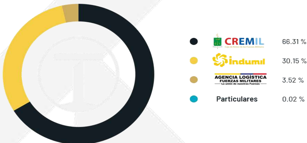
Ilustración 2. Participación accionaria

Las reuniones extraordinarias se efectuarán cuando las necesidades imprevistas o urgentes de la compañía así lo exijan. Sin perjuicio de lo dispuesto, la Asamblea General de Accionistas podrá reunirse extraordinariamente, en cualquier tiempo, por convocatoria realizada conforme a los estatutos.