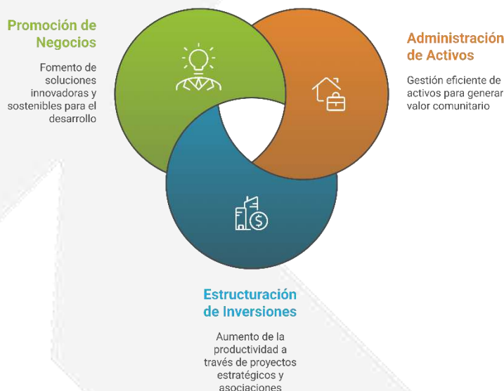
Ilustración 1. Modelo empresarial SHT